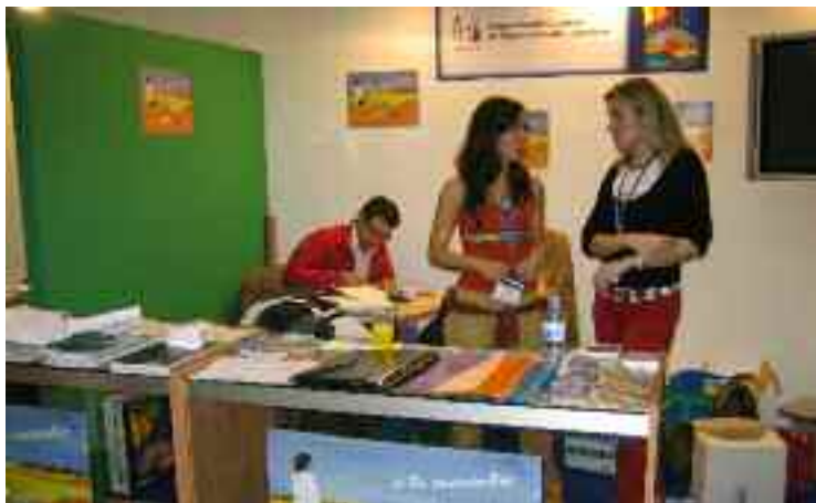
Estand representativo de socalemFYC en el Congreso Nacional semFYC 2006 celebrado en Valencia

Uno de los grandes proyectos en los que la Sociedad Castellana y Leonesa se ha visto envuelta durante parte del pasado año 2006 ha sido asumir la sede del próximo Congreso Nacional de Medicina de Familia y Comunitaria de semFYC a celebrar en 2007. Las personas integrantes de los equipos de organización y científico ya se encuentran trabajando en la planificación de unos de los eventos de mayor trascendencia que se celebrará en nuestra Comunidad y de la mano de nuestra sociedad socalemFYC. La visita al congreso de 2006 celebrado en Valencia nos sirvió para tomar ejemplo de aquellas cosas que mejores resultados obtuvieron entre los asistentes.