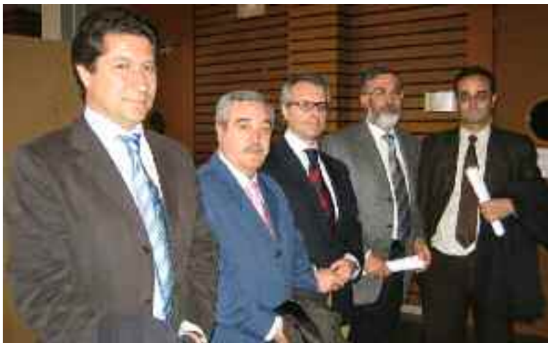
Miembros de la mesa de inauguración en la Jornadas de Residentes celebradas en la capital leonesa el pasado año