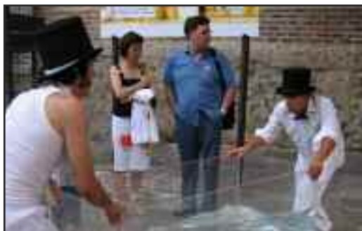
Izq: Reunión de los responsables de organización del Congreso Regional de socalemFYC. Arriba: Momento del acto teatralizado que tuvo lugar dentro del programa cultural del congreso .