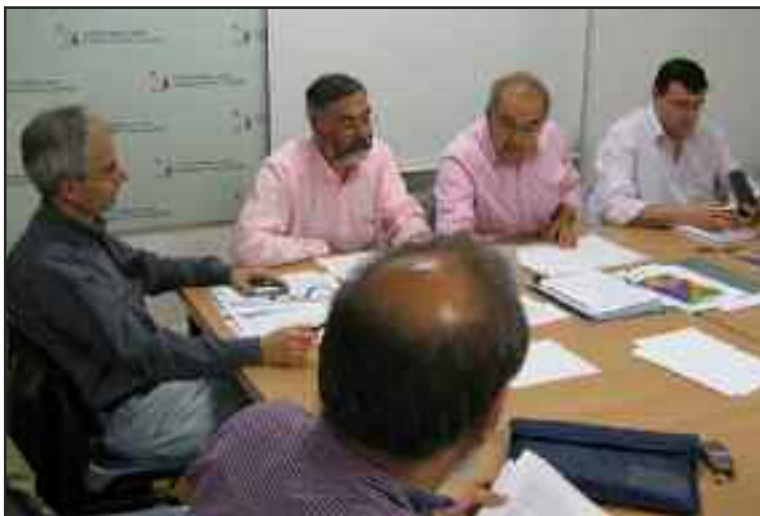
Reunión de los Comites Organizador y Científico del Congreso Nacional semFYC en la sede de socalemFYC