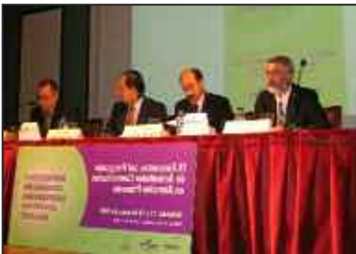
Mesa de inauguración del encuentro nacional Pacap que se celebró en Valladolid