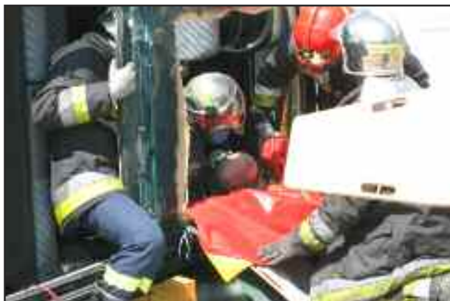
Simulacro de rescate de una víctima atrapada en un vehículo siniestrado

Valladolid recibió, los días 22 y 23 de julio, la primera de las citas organizadas por semFYC sobre actualización en Medicina de Urgencias y Emergencias. Estas actividades, en las que se combinaron los contenidos teóricos con los prácticos, contaron con una alta participación, ya que las jornadas consiguieron reunir en su primera cita a unos 200 médicos de familia de toda España. El contenido de las jornadas se completó con dos exhibiciones. Una demostración de rescate de un conductor atrapado en un vehículo siniestrado, realizada por el grupo de bomberos de Valladolid. Y una búsqueda de personas atrapadas en montaña por perros de la Guardia Civil.